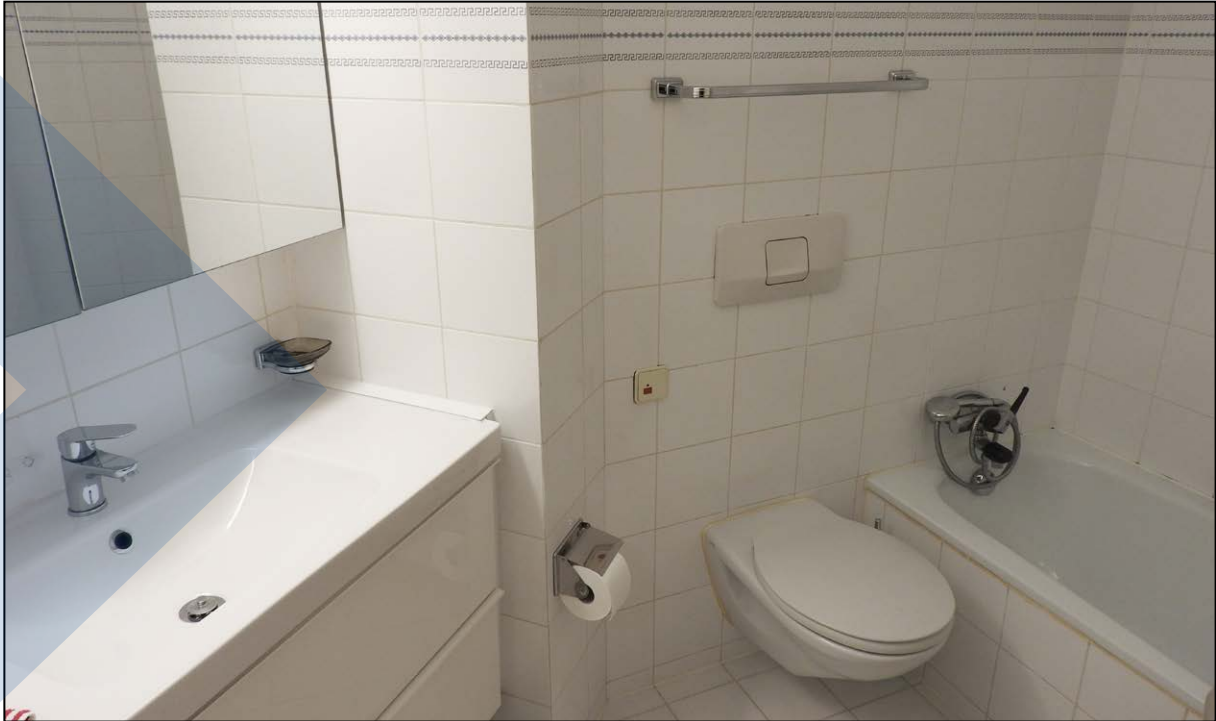
Unità separata aggiuntiva di circa 10 mq